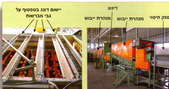
תמונה 1: דינוג מסחרי במערך בית האריזה. התמונה משמאל מראה את אופן הדינוג באמצעות טפטוף על גבי מברשות, והתמונה מימין מראה את כלל מערך האריזה עם תעלות הייבוש לפני ואחרי האפליקציה של הדונג

בעבר נגרמו נזקים רבים לתוצרת הקלאית כתוצאה מבעיות בפורמולציה של הדונג, כגון התייבשות והתפוררות הדונג, שקיעת חלקיקים, ייבוש לקוי וכד', ואולם סוגי הדונג המסחריים כיום הם באיכות מעולה ואנו כמעט שלא עדים כלל לבעיות הכרוכות באיכותם. הדונג מיושם בדרך כלל במערך בית האריזה באמצעות טפטוף על גבי מברשות, המורחות אותו על פני הפרי (תמונה 1). בנוסף, חשוב להקפיד שהפרי יעבור במנהרת ייבוש לפני ואחרי הטיפול בדונג, וכי אורך המנהרה וקצב העברת הפרי יאפשרו את ייבושו המוחלט של הדונג.