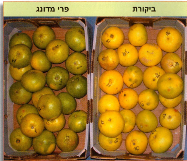
תמונה 4: השפעת דינוג על השתנות הצבע של פירות פומלית לאחר קטיף. פירות פומלית נקטפו בצבע ירוק והושארו כביקורת (ימין) או טופלו בדונג זיודר (שמאל). התמונות צולמו כעבור שישה שבועות אחסון בטמפרטורה של 12 מ"צ