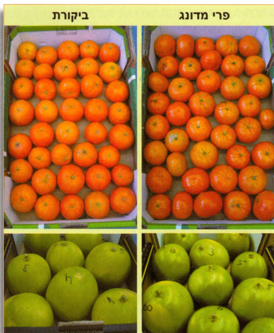
תמונה 2: מראה פירות הדר עם וללא דונג. התמונות של פירות מנדרינה 'מור' (למעלה) ופומלו 'גוליית' (למטה) צולמו כעבור ארבעה שבועות אחסון בטמפרטורה האופטימלית של כל זן וחמישה ימים נוספים של שהייה בחיי מדף

של שהייה בחיי מדף. ניתן לראות שהפירות המדונגים מבריקים ואטרקטיביים לצרכנים, בעוד שפירות הביקורת בעלי מראה דהוי ועייף (תמונה 2). בסך הכל, בכל נסיונות האחסון שערכנו צרכנים תמיד העדיפו מראה של פרי מדונג על פני פירות ביקורת ללא דונג.